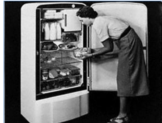
LE FRIGIDAIRE - LE FRIGO